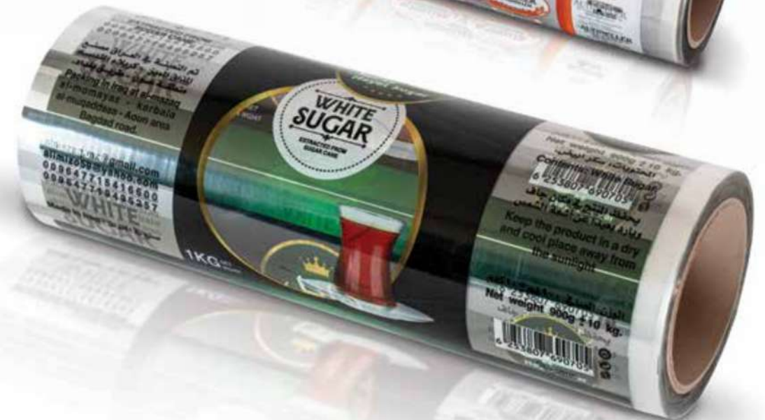
Bedruckte Shrink Folie