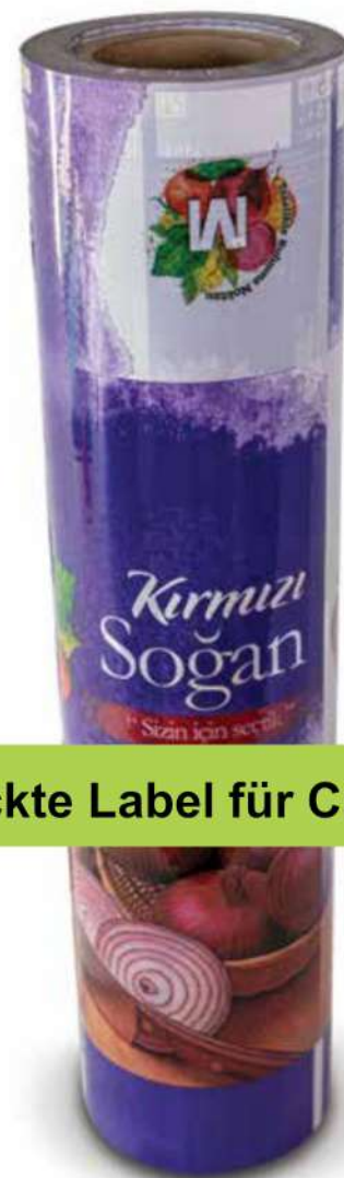
Bedruckte Label für Carry Fresh

Unsere Carry Fresh Folien sind verfügbar als: