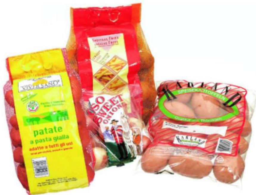
Bedruckte Label und Verpackungsfolien